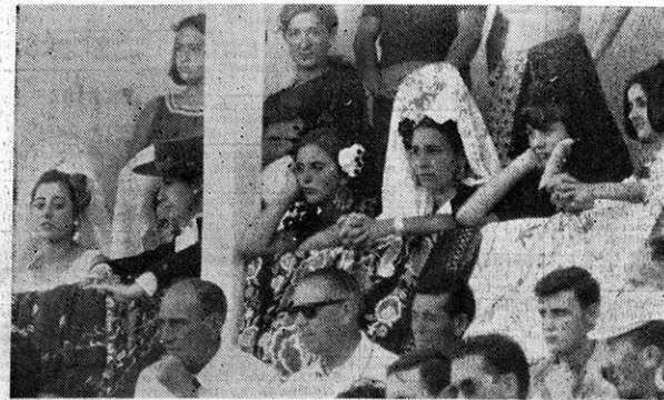
Un ramillete de guapas tudelanas sigue las incidencias de la corrida.