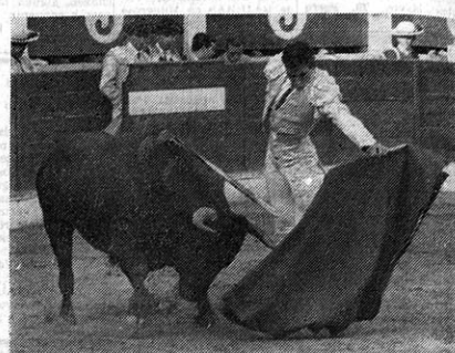
— (F. Peinado y Maem.)