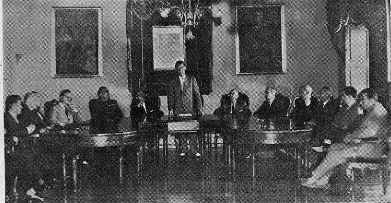
El Alcalde de Estella dirigió la palabra a los asistentes a la I Semana de Estudios Medievales.