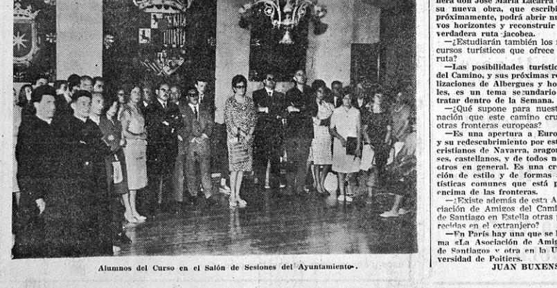
Alumnos del Curso en el Salón de Sesiones del Ayuntamiento.

«En París hay una que se llama «La Asociación de Amigos de Santiago» y otra en la Universidad de Poitiers.