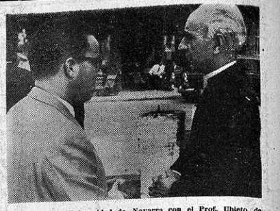
El Rector de la Universidad de Navarra con el Prof. Ubieta, de la Universidad de Valencia.

de salutación, como era su deseo, puestos que en aquel momento estaba de viaje, muy cerca ya de Estella, retenido en Madrid hasta última hora de la mañana por VUELVE A QUINTA PAGINA