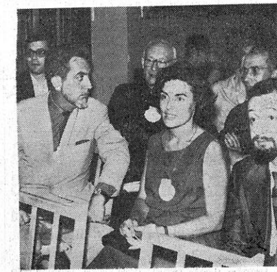
Los semanistas en el acto de apertura, con la venera que les fué impuesta por los "amigos" estelenses.