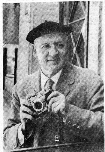
Unos se retiran en las tablas de las escaleras y otros esperan en la Plaza Consistorial. Y el callejón, claro.