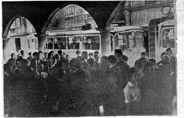
Cerería del señor Tabernero, la más antigua de las que actualmente existen en España. Llegada a Sangüesa. En los soporales del Ayuntamiento, los autobuses se han detenido. El alcalde y los concejales dan la bienvenida a los semanistas mientras los taxistas municipales entonan unos aires vascos.

servidores y dignatarios, Realejo luego la cesión que los monarcas hacían a la iglesia de edificios reales para dárles una dedicación jacobea. Cesión a la que más adelante se añaden dotaciones es-