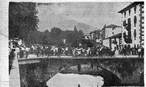
Otra de las carrozas pasa ante el regocijo de mayores y pequeños. Una partida de mus entre los baztanenses presidida por dicho partido.

Baztandarrén Biltzarra. 19 de julio. Elizondo. A las 11 y media de la mañana. El cielo estaba encapotado, pero hacía frío. La plaza llena de faldas rojas, pañuelos blancos, algortas, caras sonrientes, gritos, niños, jóvenes... Se había quedado libre solo un espacio cuadrangular para la actuación de los grupos de baile. El año pasado no, pero éste sí habían venido los dantzaris del Ayuntamiento de Pamplona.