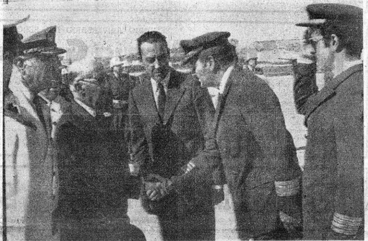
Su Excelencia el jefe del Estado, momentos antes de partir hacia Santiago, saluda en Barajas a los miembros de la tripulación que le conducirán a la ciudad del Apóstol.