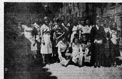
Las nuevas escorristas de la Cruz Roja que recibieron sus títulos el pasado domingo en el Ayuntamiento tudelano.