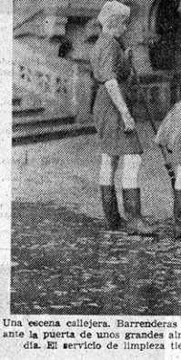
Una escena callejera. Barrenderas moscovitas, en plena Plaza Roja y ante la puerta de unos grandes almacenes, limpian la ciudad en silencio...