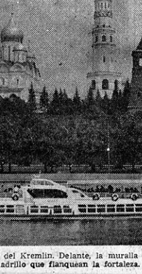
Las iglesias con las cúpulas doradas del Kremlin. Delante, la muralla oculta por los árboles y las torres de ladrillo que flanquean la fortaleza.