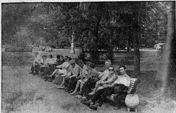
A falta de bares, los ciudadanos soviéticos pasan las mañanas del domingo en los parques públicos. Ahí están, sentados en los bancos con una expresión no demasiado divertida.