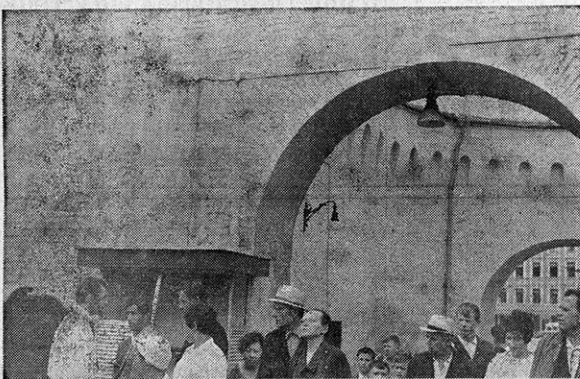
Proletario de todas las repúblicas soviéticas entrando en el Krenlin de los zares.