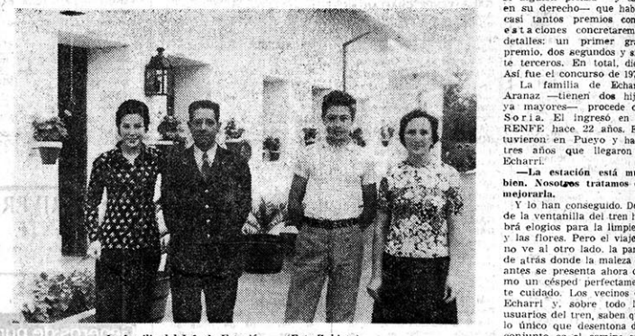
La familia del Jefe de Estación. — (Foto Zubietza).