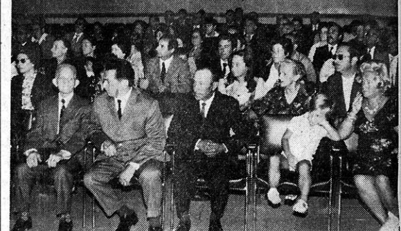
Un aspecto de la Sala de Exposiciones de la Casa Sindical durante la entrega de premios a productores distinguidos. — (Foto ZUBIETA).