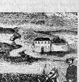
FEDERICO DE ZAVALA DE LOS FUEROS A LOS ESTATUTOS Los Conciertos Económicos Régimen Administrativo Especial para Guipúzcoa y Vizcaya.

Viene después la narración del entorno histórico en que se gesta la ley de 21 de julio de 1876, cuyo centenario se conmemora, en el «Diario de San Sebastián» con una orla negra en primera página, como puede verse en la reproducción inserta en el libro. A continuación, en otras cincuenta páginas, se estudia el régimen de conciertos económicos y se da el texto de los cinco habidos, el último en 1925-6.